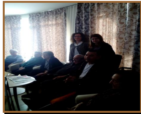
ПУСЗ „ТЕРЗИЕВА“, 2015.