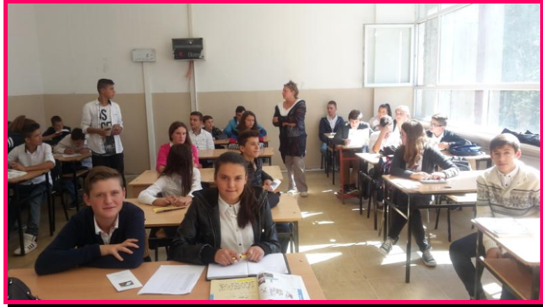
СУГС „Цветан Димов“ – општина Чаир, 2015.

Со предавњата се опфатија следните теми: