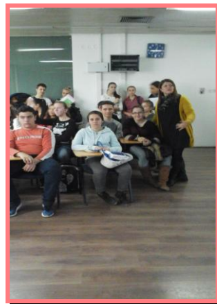
ДМБЦУ „Илија Николовски- ЛУЈ“ – општина Центар, 2015.