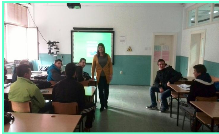
АСУЦ „Боро Петрушевски“- општина Гази Баба, 2015.