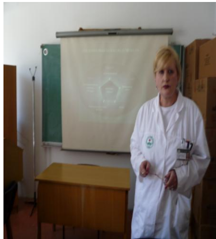
Центар за Јавно Здравје Скопје, јуни 2014 година

За таа цел, согласно заклучоците на Комитетот за Здравје и животна средина при Министерството за здравство, активностите започнаа со едукација на вработените: здравствени работници и соработници.