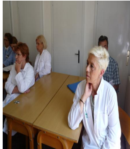
Центар за Јавно Здравје Скопје, јуни 2014 година

Во месец јуни 2014 година со здравствена едукација на подрачјето на Скопје беа опфатени и старите лица. За таа цел беше посетена Приватната установа за социјална заштита на стари лица „Жана” во општина Бутел. При посетата беа одржани 2 предавања на 29 стари лица на следните теми: