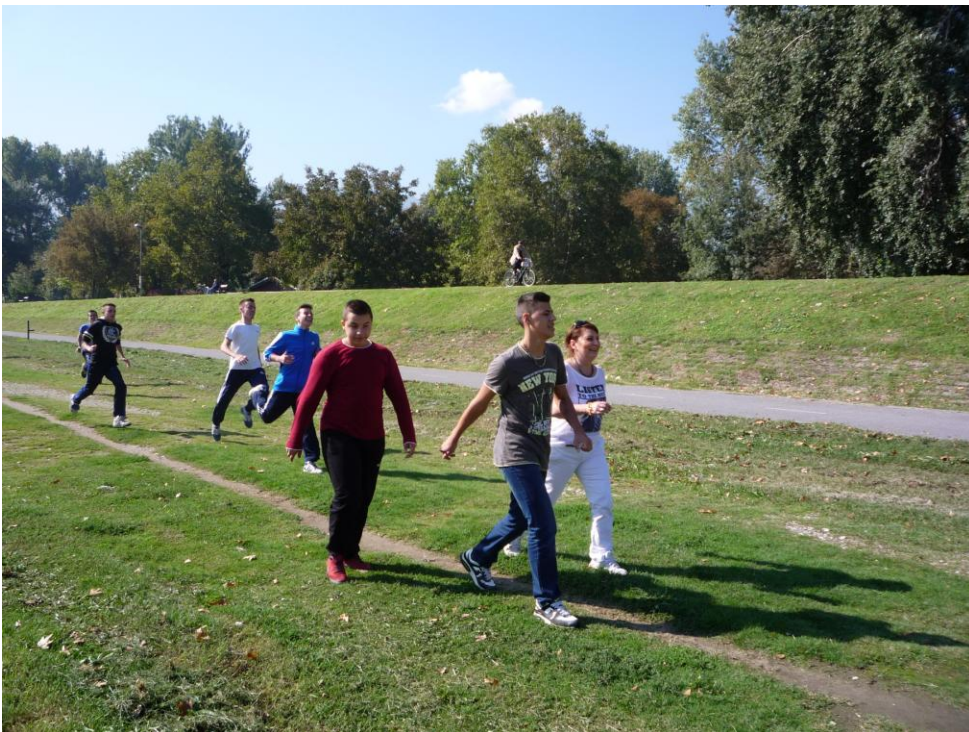
29-ти септември 2014, на кејот во Скопје