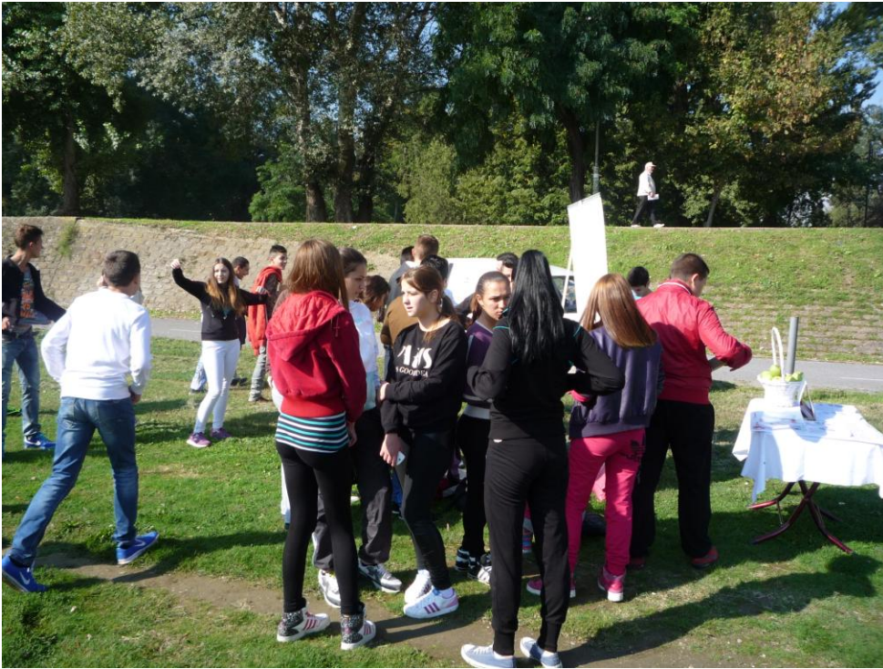
29-ти септември 2014, на кејот во Скопје