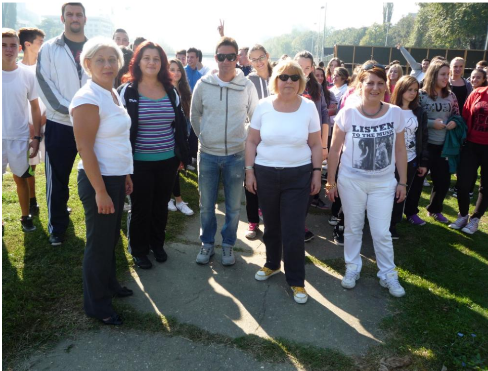
29-ти септември 2014, на кејот во Скопје

Изминатите години градот Скопје имаше навистина успешни проекти кои денес им овозможуваат на жителите рутинирано да практикуваат од лесни прошетки до самоорганизирани натпревари од различен вид на повеќе локации во градот.