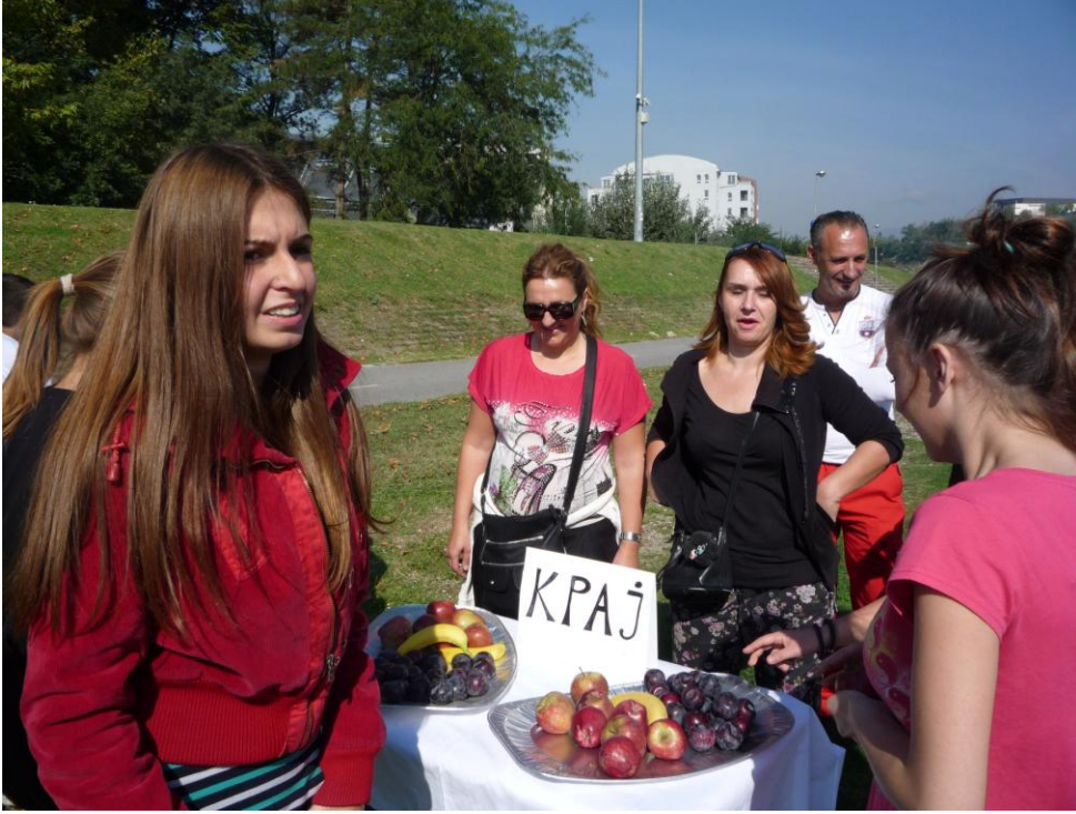
29-ти септември 2014, на кејот во Скопје