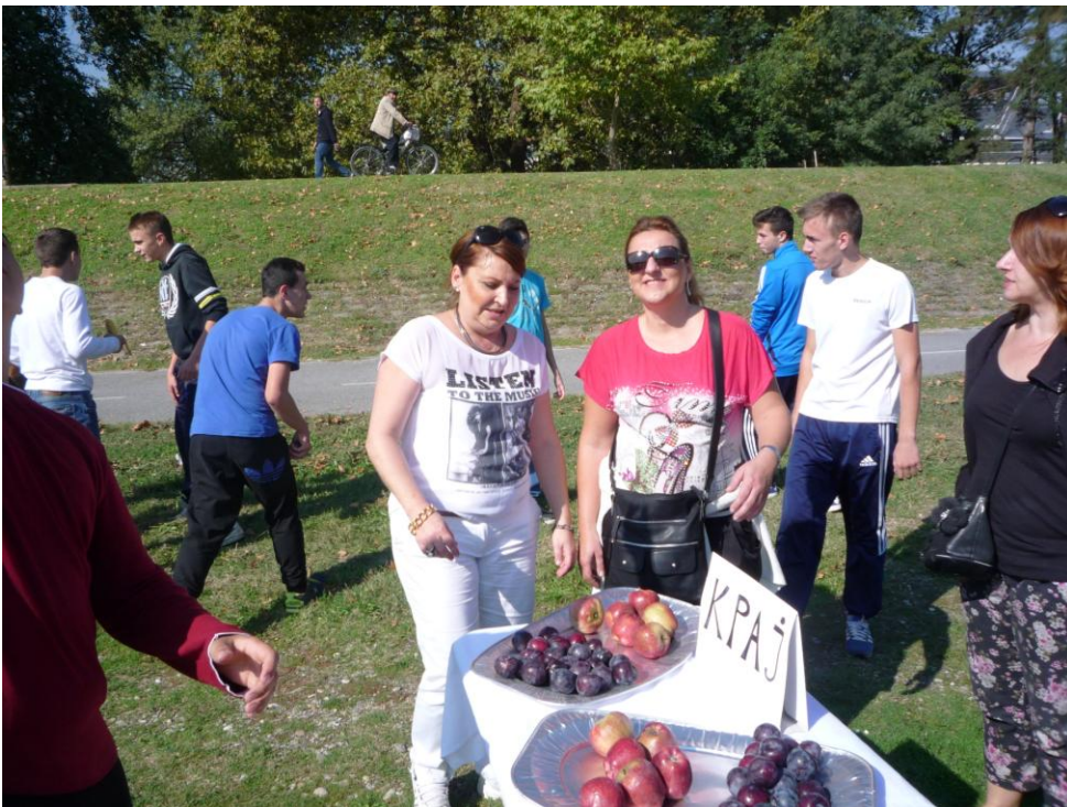
29-ти септември 2014, на кејот во Скопје