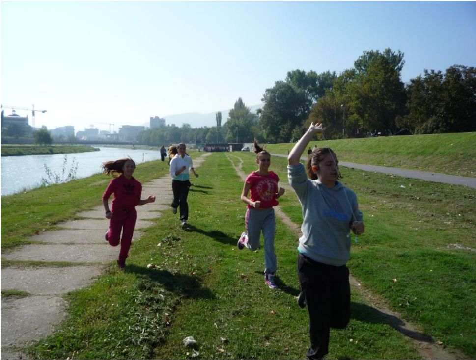
29-ти септември 2014, на кејот во Скопје